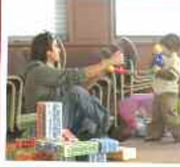
RENCONTRES ET DISCUSSIONS