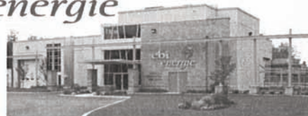
Station de traitement et de valorisation des biogaz