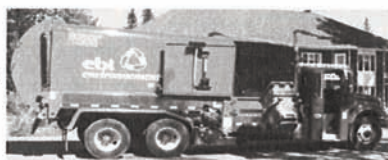
Camions adaptés aux différentes collectes des matières résiduelles

Reduction Recyclage Réutilisation Récupération Valorisation