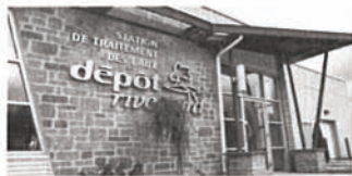
Station de traitement des eaux de lixiviation