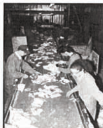
Tables de tri