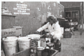
Éco-parc et dépôt des résidus domestiques dangereux