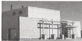
Centre de traitement des boues de fosses septiques