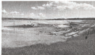
Lieu d'enfouissement technique