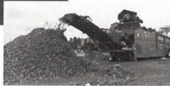
Plate-forme de compostage de 35 000 m 2