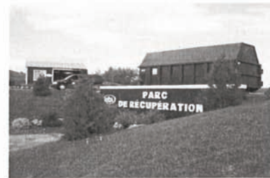
Éco-parc et dépôt des résidus domestiques dangereux