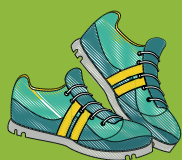
Souliers de course fermés