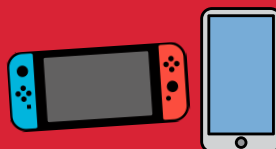
Jeux électroniques et téléphones