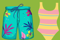
Maillot de bain