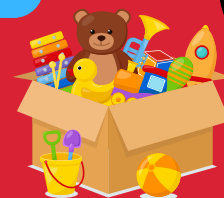
Jouets de la maison