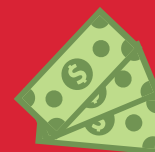
Argent de poche