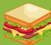
Lunch froid ou qui n'a pas besoin d'être chauffé