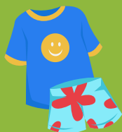
Vêtements de rechange (au besoin)